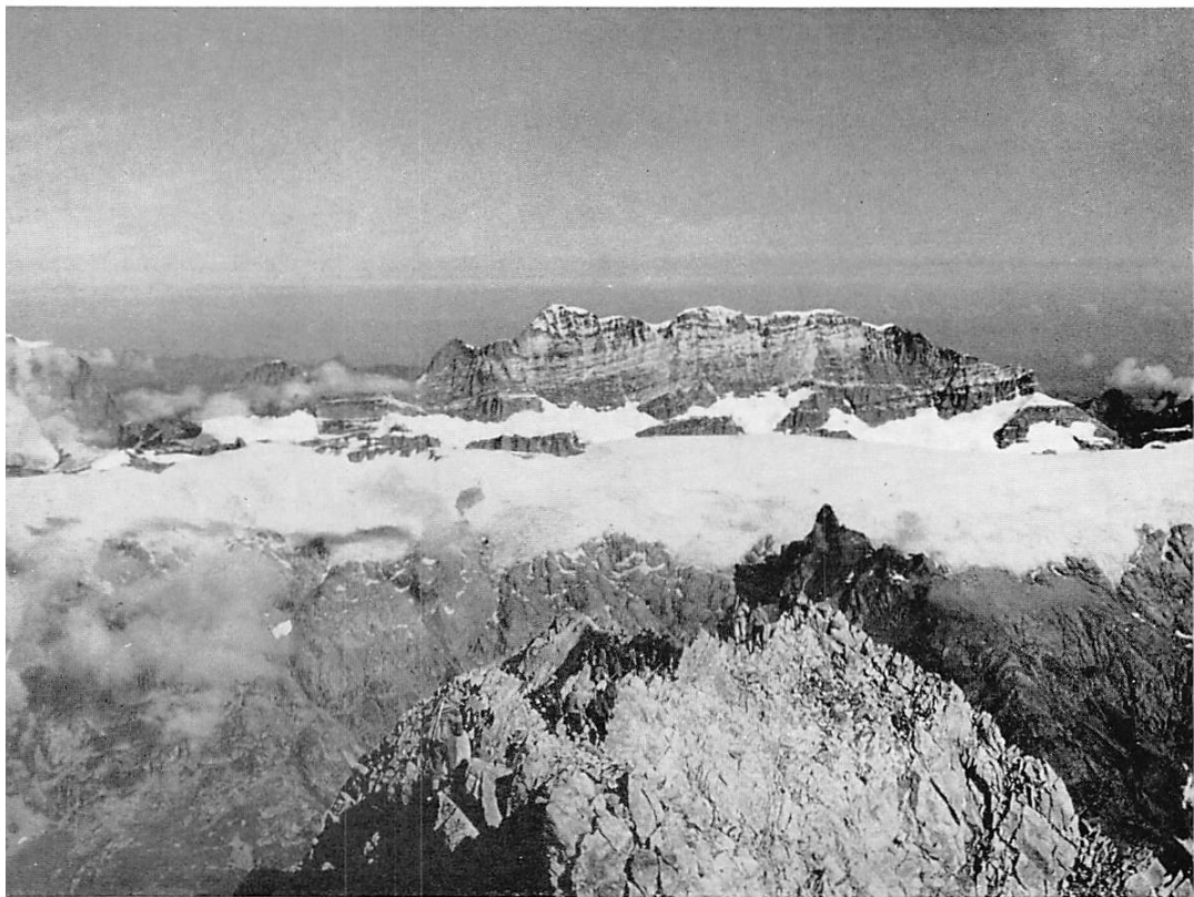
Ausblick vom Bietschhorn gegen Petersgrat und Blümlisalp